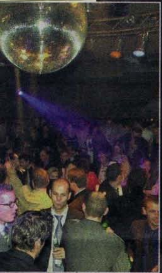
◀ Im „Nachflug“ wird bald die schärfste Party der Stadt steigen